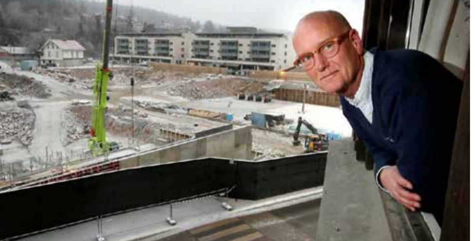
– Vi er kjempefornøyde over å komme over i nye lokaler – det er en annen verden fra forrige lokale, sier b...

– Noe lengre prosesser må man påregne med tanke på å få inn deler av handelsbransjen i disse koronatider. Men nye bransjer og drivere vil alltid komme på banen så lenge markedet er der, mener Tandberg.