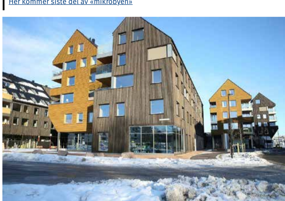
Byggetrinn en ble ferdig tre måneder før tiden på Heggedal Torg. Nå er byggetrinn to i full gang.